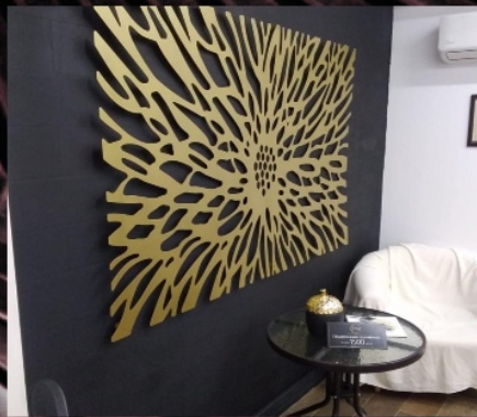
ЛАЗЕРНАЯ РЕЗКА ЛИСТОВОГО МЕТАЛЛА